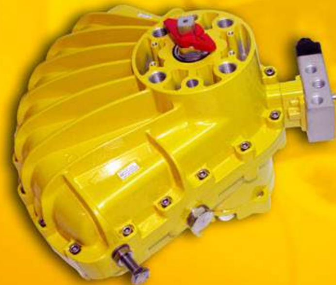
Adaptador per a electrovàlvula Namur Adaptador para electroválvula Namur Adaptador para electroválvula Namur