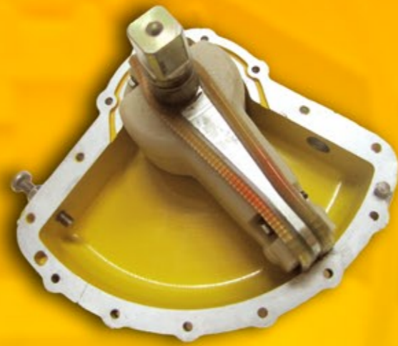
Actuador pneumàtic de paleta, doble efecte Actuador neumático de paleta, doble efecto Actuador pneumático de palheta, duplo efeito