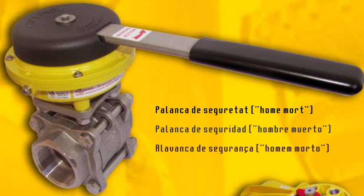
Palanca de seguretat ("home mort") Palanca de seguridad ("hombre muerto") Alavanca de segurança ("homem morto")