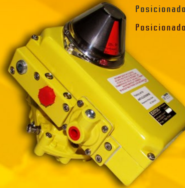
Posicionador pneumàtic, electro-pneumàtic i de 3 posicions. Posicionador neumático, electro-neumático y de 3 posiciones. Posicionador pneumático, electro-pneumático e de 3 posições.