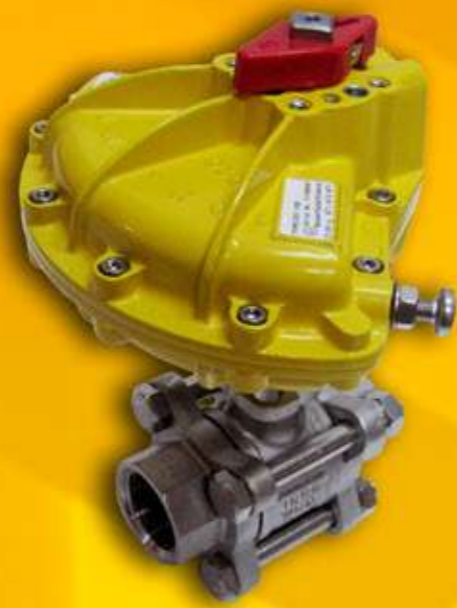
Muntatge conjunt actuator - vàlvula Montaje conjunto actuator - válvula Montagem conjunto actuator - válvula