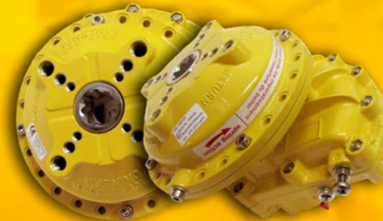
Molla amb connexió ISO 5211 / DIN 3337 Muelle con conexión ISO 5211 / DIN 3337 Mola com ligação ISO 5211 / DIN 3337